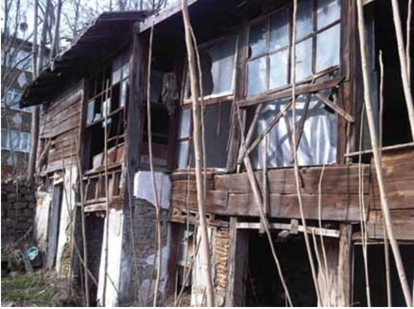
Necmi İçe Evi