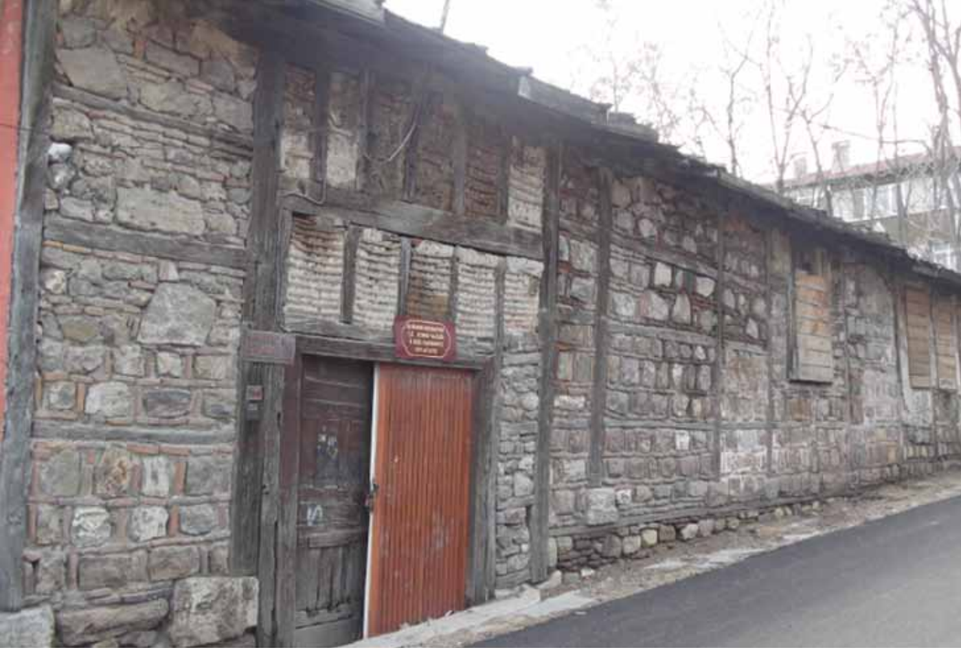
Necmi İçe Evi