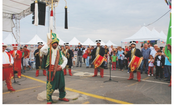
Mehteran Takımı ve Yağlı Güreş Gösterileri