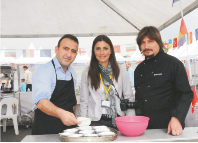
Türk, Gürcü ve Bulgar Mutfağı'ndan Lezzetler

ve yöresel 'Bulama' yapımıyla devam etti. Türk, Gürcü ve Bulgar Mutfağı'ndan yemeklerin sergilendiği etkinliğin ikinci gününde Kırkpınar Yağlı Güreşleri gösterileri ve Lüleburgaz Uçan Eller Kukla Evi'nin gösterisi katılımcılar tarafından ilgiyle izlendi.